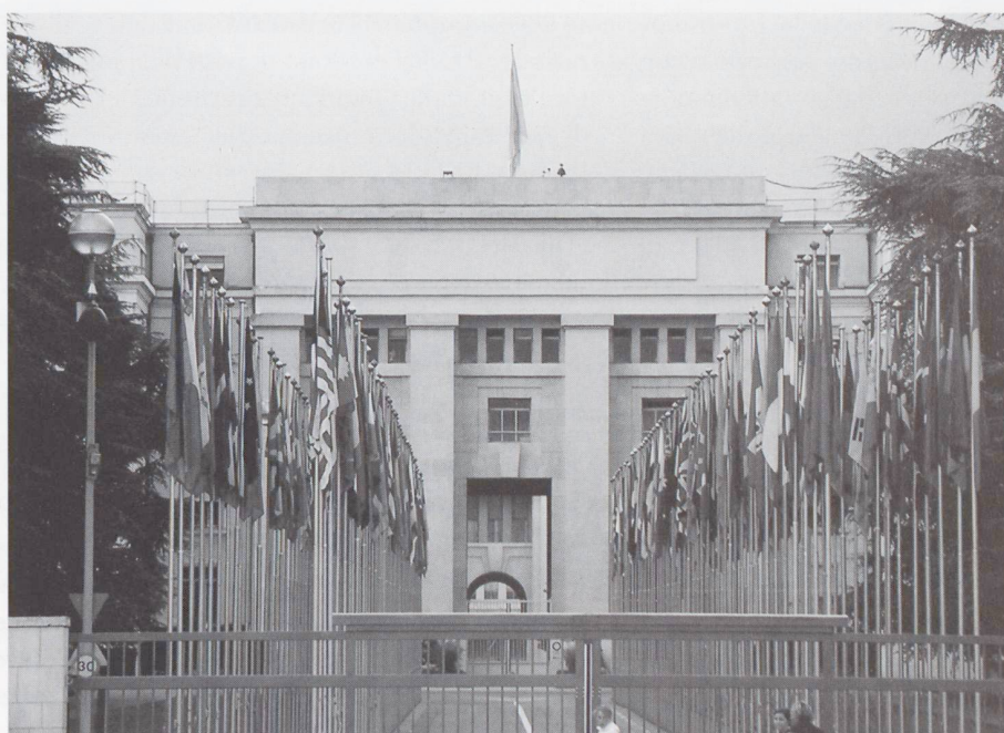
Palazzo della Società delle Nazioni, 2004