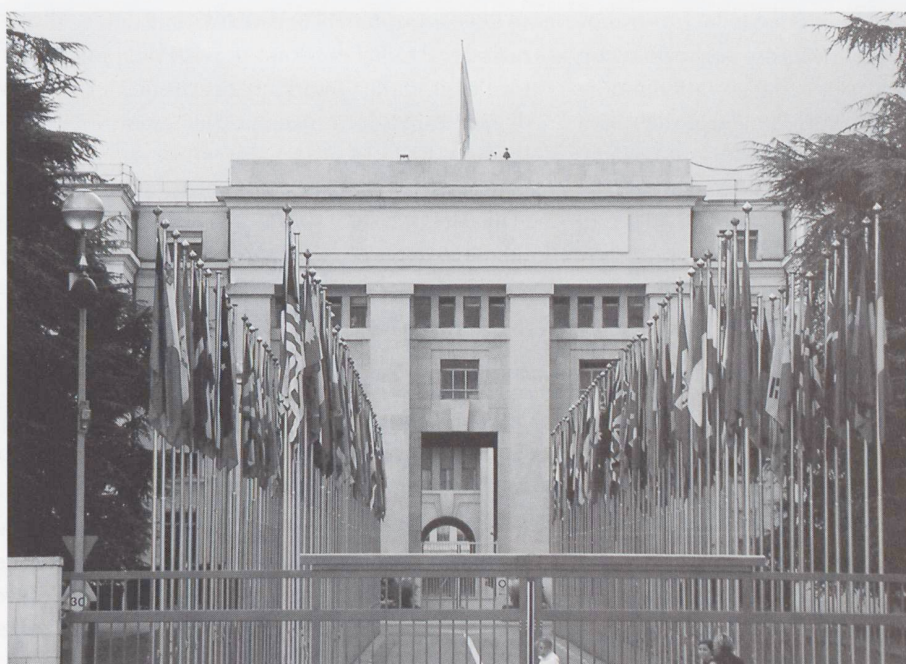
Palazzo della Società delle Nazioni, 2004