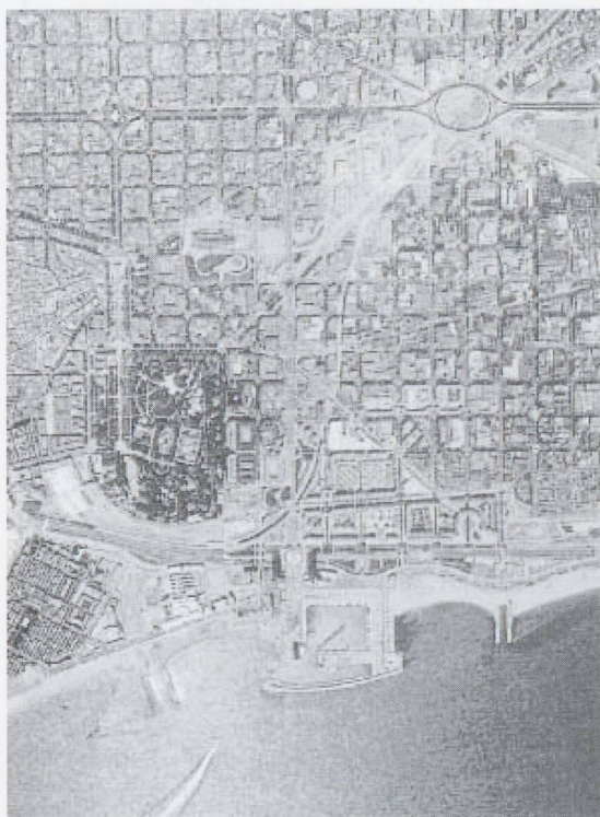
Veduta zenitale del Parc de Litoral alla Villa Olimpica, Barcellona

L'esame e l'interpretazione di riflessioni, denunce, cronache, progetti e proposte di diverso segno disciplinare, provenienti anche dalla stampa quotidiana e periodica, fatte sui numerosi testi e documenti della «Libreria» della ricerca, ci hanno suggerito come sia possibile individuare alcune idee sulla città, prevalenti e ricorrenti, che percorrono la cultura contemporanea. Pur nella varietà di posizioni ed espressioni, ci è sembrato di poter riconoscere un numero limitato di concetti che riguardano quelli che possono esser ritenuti i caratteri fondamentali della cultura della città contemporanea. Questi concetti, che sono stati classificati in numero di sette, rappresenterebbero le idee necessarie, o fondative o archetipe, che riguardano la città.