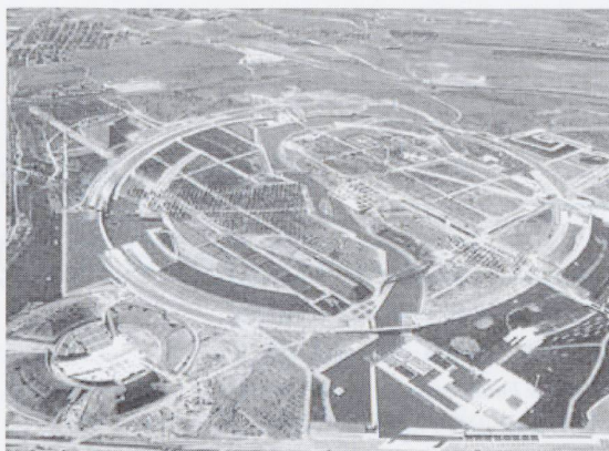
Parque Juan Carlos I, Madrid veduta aerea (E. Esteras Martín, J.L. Esteban Penelàs)

La relazione di Dematteis affronta il cambiamento in corso della pianificazione e della figura del pianificatore. Da scienza principalmente rivolta a produrre piani cioè indicazioni e norme rivolte a fissare le regole d'uso di risorse date, la disciplina si avvia a diventare scienza e tecnica delle politiche territoriali; cioè dei processi interattivi che promuovono e regolano la creazione e la crescita di valori urbani (ciò che Dematteis definisce territorialità di secondo tipo). In questi processi i piani rappresentano ora solo dei momenti e degli strumenti particolari, meno decisivi che nel passato. E questo noi crediamo possa rappresentare una seconda rilevante questione da porre all'interno del progetto di fattibilità.