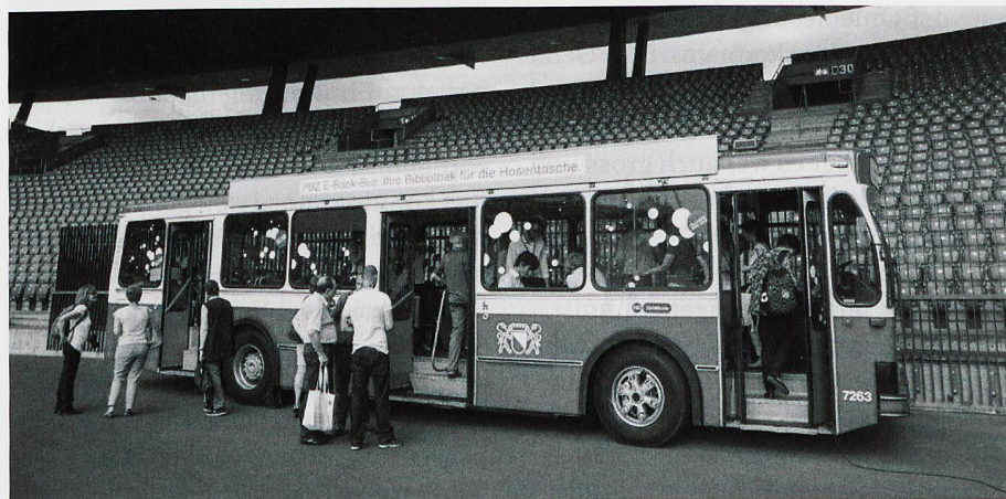
Der E-Book-Bus der PBZ im Zürcher Letzigrund-Stadion.