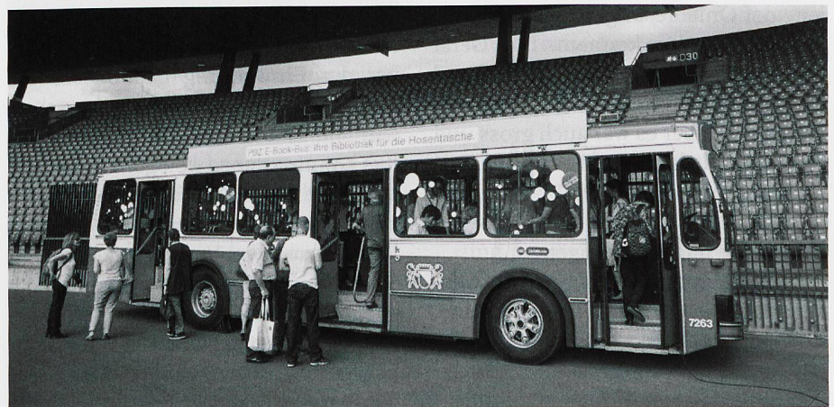
Der E-Book-Bus der PBZ im Zürcher Letzigrund-Stadion.

Die Planung des Projekts war zeitintensiv. Die Idee, die Mobilität von E-Medien durch einen Bus zu symbolisieren war spontan entstanden und ziemlich einleuchtend. Einen Bus zu finden, der temporär als mobile Bibliothek umgenutzt werden kann, erwies sich als komplizierter. Zu Hilfe kam der Zufall. Die Verkehrsbetriebe Zürich VBZ wurden genau wie die Pestalozzi-Bibliothek 1896 gegründet und feierten ebenfalls einen Geburtstag. Die Anfrage um Unterstützung, von Geburtstagskind zu Geburtstagskind, stiess deshalb auf offene Ohren und so war bald ein entspre-