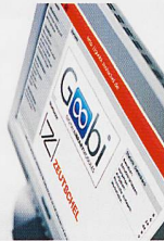
Goobi ZED Software-Lösungen für Digitalisierungsprojekte