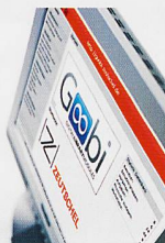
Goobi ZED Software-Lösungen für Digitalisierungsprojekte