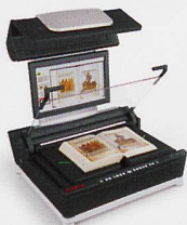
Buchscanner Vorlagengrößen von A3 bis A0