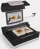
Buchscanner Vorlagengrößen von A3 bis A0