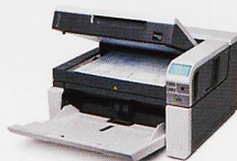
Dokumentenscanner Geschwindigkeit bis 210 Seiten/Min.