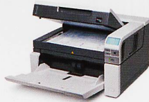
Dokumentenscanner Geschwindigkeit bis 210 Seiten/Min.