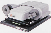
Mikrofilmscanner für alle Mikrofilmarten (Rollfilme, Mikrofichen, etc)