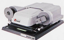
Mikrofilmscanner für alle Mikrofilmarten (Rollfilme, Mikrofichen, etc)