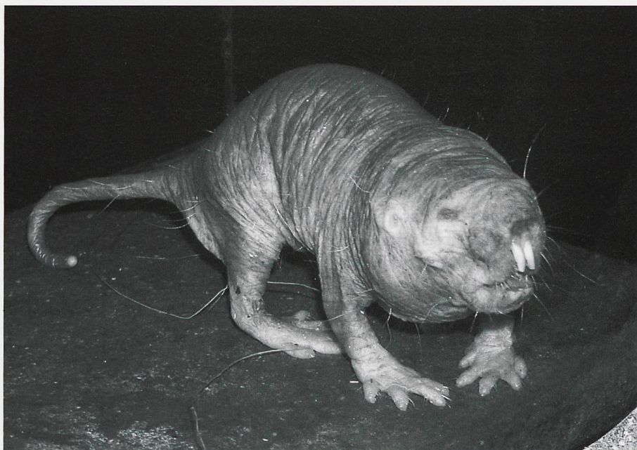
Ill. 2: Le rat-taupe nu ( Heterocephalus glaber ) est un petit rongeur remarquable non seulement pour son apparence physique.

gardé en tant qu'espèce. Par contre, des recherches de 2005 ont montré que l'animal pouvait vivre jusqu'à 50 ans, qu'il était insensible à la douleur et surtout qu'il avait une forte résistance aux maladies cancéreuses. Cela l'a remis de facto sur le podium des animaux suscitant l'intérêt des humains. Par analogie, effacer une donnée aujourd'hui ne veut pas dire qu'elle n'aura pas d'importance à l'aulne des critères du futur. Et si les coûts sont inférieurs ou équivalents, pourquoi éliminer l'information?