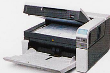
Dokumentenscanner Geschwindigkeit bis 210 Seiten/Min.