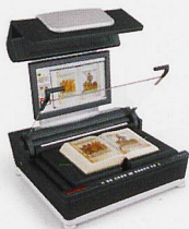
Buchscanner Vorlagengrößen von A3 bis A0