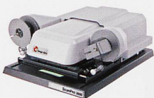
Mikrofilmscanner für alle Mikrofilmarten (Rollfilme, Mikrofichen, etc)