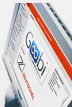
Goobi ZED Software-Lösungen für Digitalisierungsprojekte