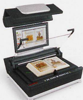
Buchscanner Vorlagengrößen von A3 bis A0