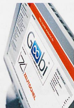
Goobi ZED Software-Lösungen für Digitalisierungsprojekte