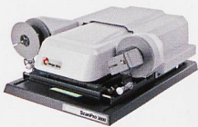
Mikrofilmscanner für alle Mikrofilmarten (Rollfilme, Mikrofichen, etc)