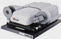
Mikrofilmscanner für alle Mikrofilmarten