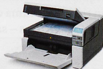
Dokumentenscanner Geschwindigkeit bis 210 Seiten/Min.