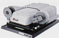
Mikrofilmscanner für alle Mikrofilmarten