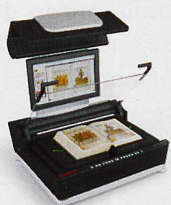
Buchscanner Vorlagengrößen von A3 bis A0