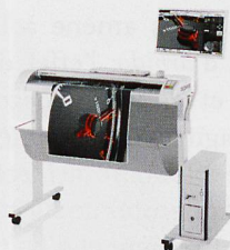
Planscanner Scanbreiten von 61 bis 152cm