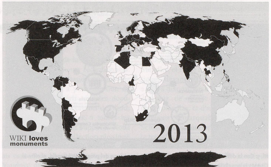
Ill. 2: Nel 2014 Wikimedia CH ha deciso di dedicare il concorso Wiki Loves Monuments alla zona alpina.

Il progetto ha portato a una cernita delle fonti sulla storia alpina sia on line che off line, all'analisi delle risorse in rete, soprattutto iconografiche, alla rielaborazione di articoli fondamentali su Wikipedia e al caricamento su Wikisource di alcuni numeri della rivista di Storia delle Alpi pubblicata annualmente dalla stessa associazione.