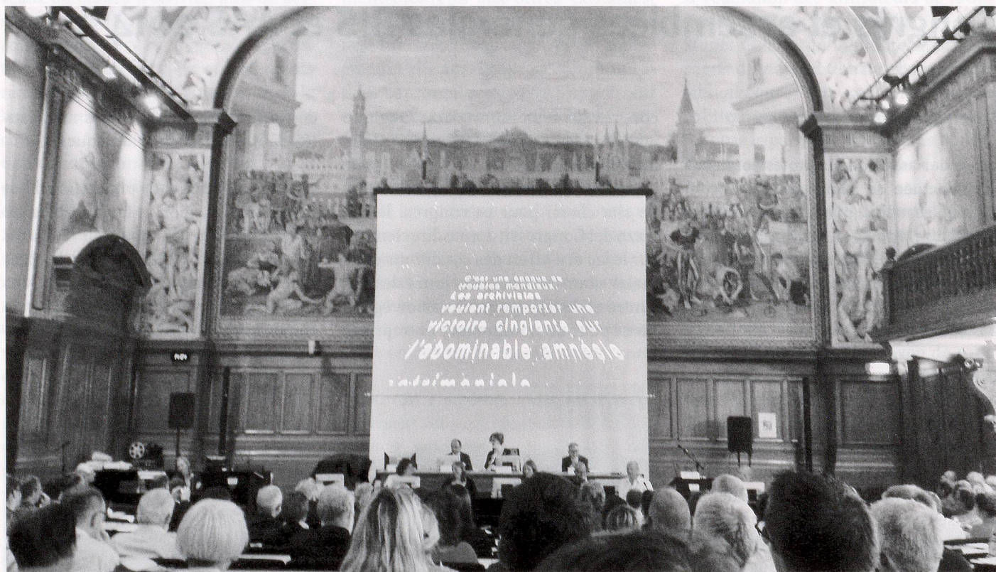
AG 2014 AAS: Palais de Rumine, Lausanne.