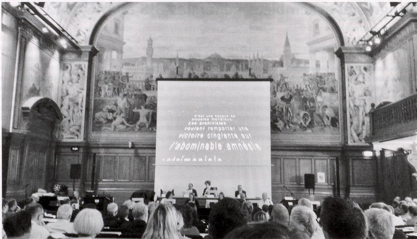
AG 2014 AAS: Palais de Rumine, Lausanne.