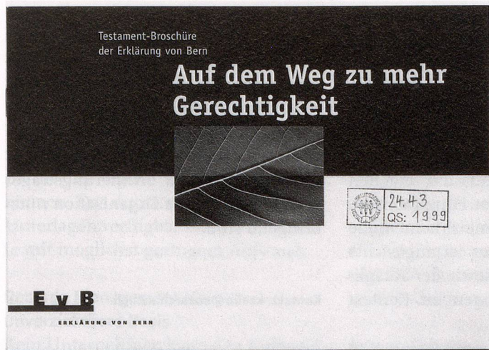
Testament-Broschüre der Erklärung von Bern (EvB), 1999.