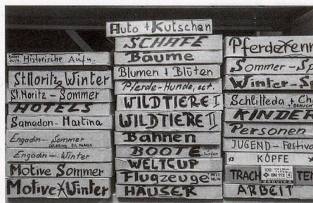
Viel Arbeit: fotografischer Nachlass in Bearbeitung.

Einmalig ist die Recherche in der Bilddatenbank, die online zugänglich ist. Sie umfasst rund 13000 Bilder, die systematisch erfasst und erschlossen sind. Die Bilder sind eine ausserordentlich reiche Quelle für unterschiedlichste Forschungs- und Publikationszwecke. In Zusammenarbeit mit dem Institut für Medienwissenschaften der Universität Basel wird die Datei momentan überarbeitet und die Funktionalität verbessert.