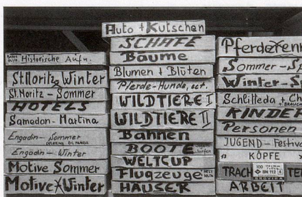
Viel Arbeit: fotografischer Nachlass in Bearbeitung.

Einmalig ist die Recherche in der Bilddatenbank, die online zugänglich ist. Sie umfasst rund 13000 Bilder, die systematisch erfasst und erschlossen sind. Die Bilder sind eine ausserordentlich reiche Quelle für unterschiedlichste Forschungs- und Publikationszwecke. In Zusammenarbeit mit dem Institut für Medienwissenschaften der Universität Basel wird die Datei momentan überarbeitet und die Funktionalität verbessert.