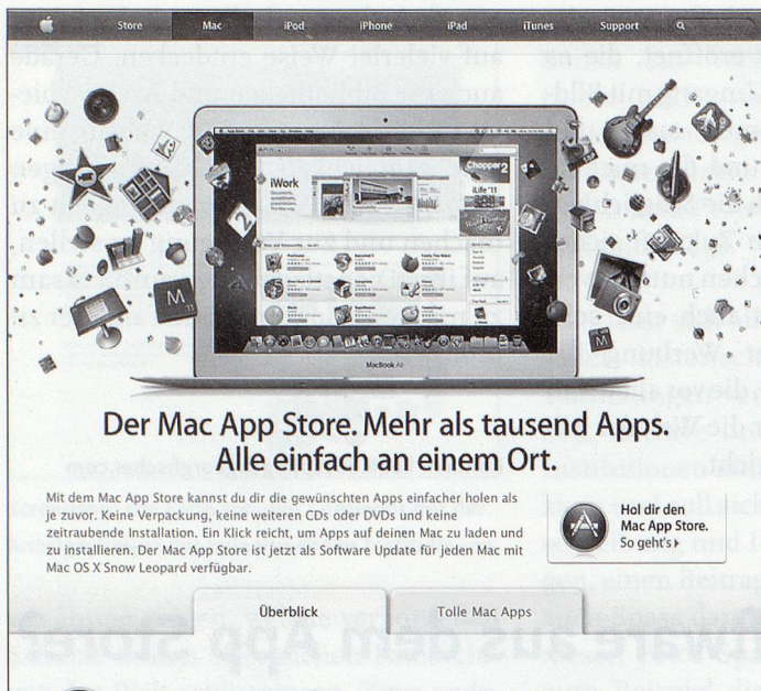
Screenshot Mac App Store