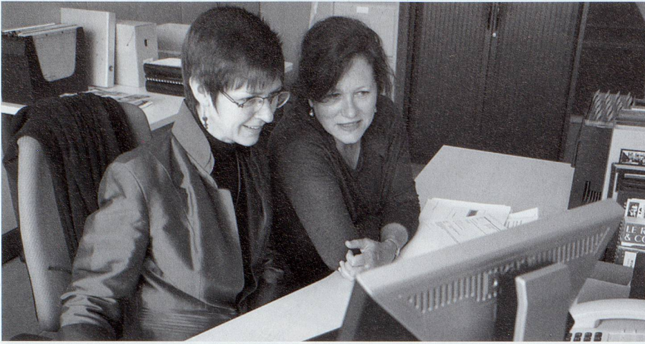
La bibliothécaire et l'archiviste compilent les informations.