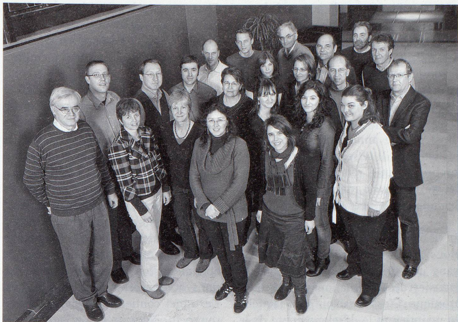
Les collaboratrices et collaborateurs du Service de documentation.

Le secrétariat élabore avant chaque session de chaque chambre un aperçu des matières qui y seront traitées. Cet aperçu contient en résumé les informations importantes relatives à chaque objet. Il est également disponible sur internet et constitue un important ins-