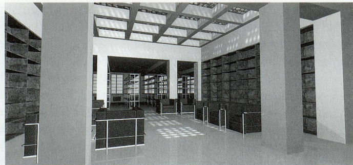
Alkoven der PBZ-Hauptstelle: zwischen staubigem Umbau und der vom Computer dargestellten Zukunft.