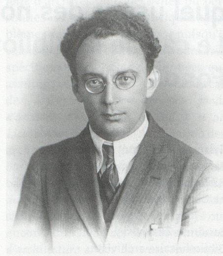
Portrait de Jules Humbert-Droz (Fonds Jules Humbert-Droz).

Un second travail de diplôme BBS, achevé en 1998, a soulevé le problème de la normalisation de la description archivistique 5 et de la diffusion de l'information dans les secteurs de recherche (universités, bibliothèques,