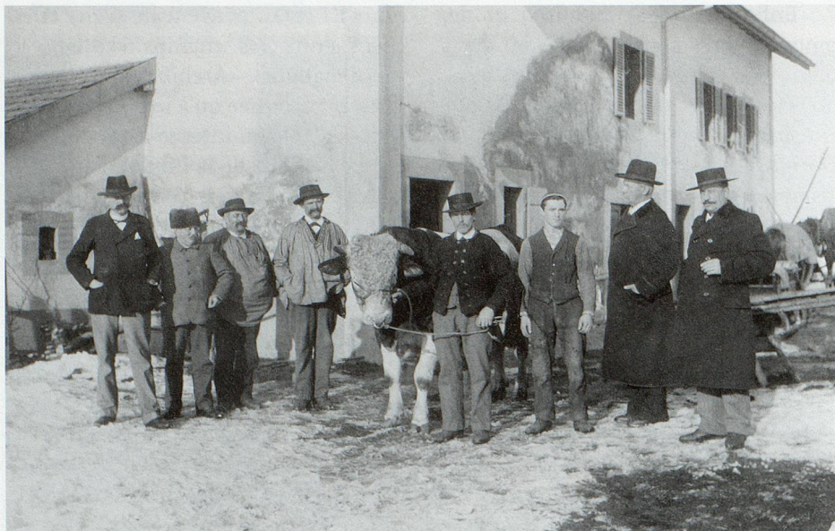
Photographie de membres de la Société d'agriculture.

des civilistes. L'information donnée par la description peut à tout moment être modifiée, précisée ou revue en fonction d'une connaissance plus précise du contenu des fonds ou d'un besoin nouveau.