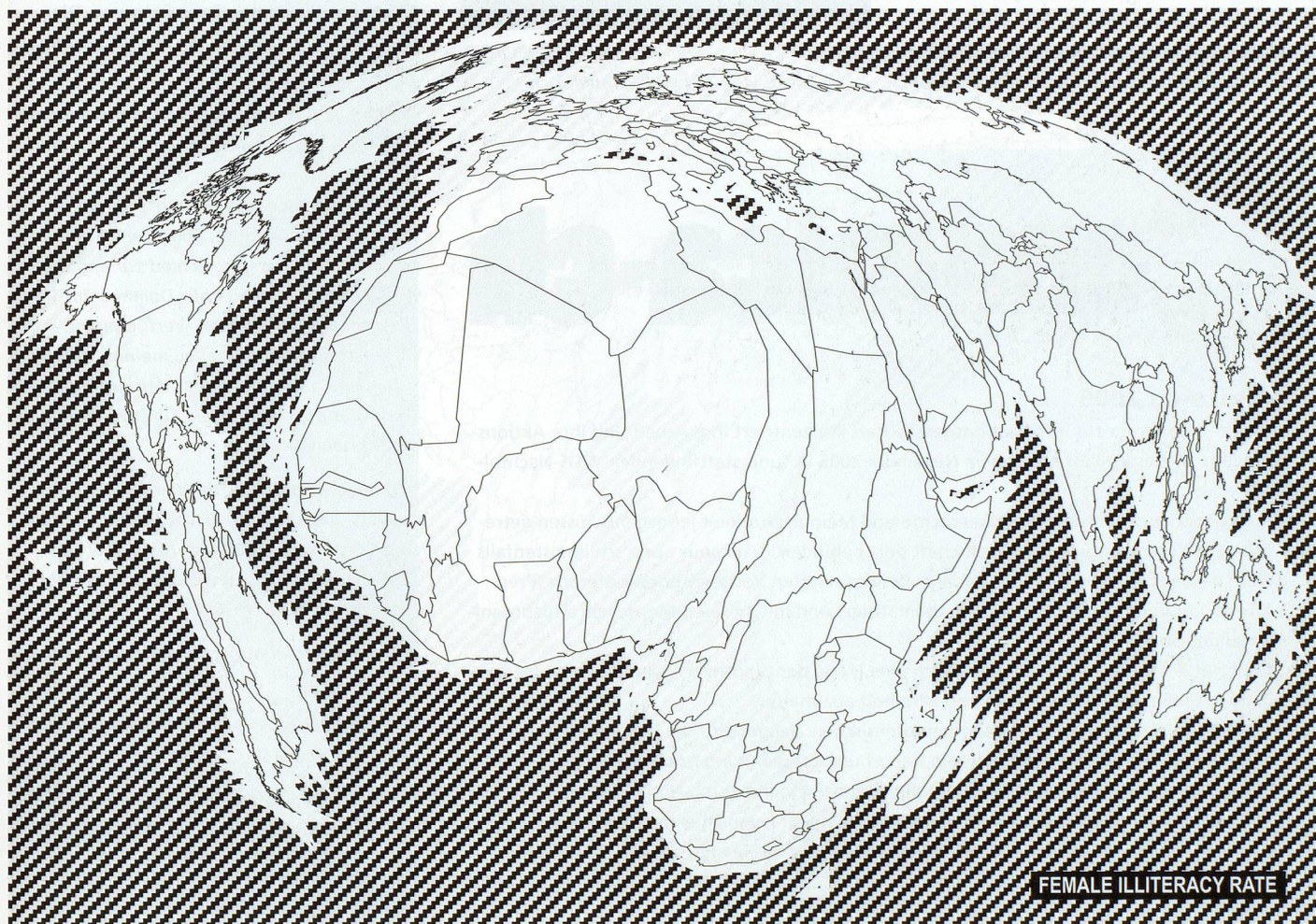
Female illiteracy rate. Global Monitoring Report, 2003, Unesco. → http://www.efareport.unesco.org/

Neben den von Lawrence Lessing entwickelten CC-Lizenzen gibt es inzwischen eine breite Palette unterschiedlicher Lizenzierungssysteme wie die GPL ( GNU Gene-