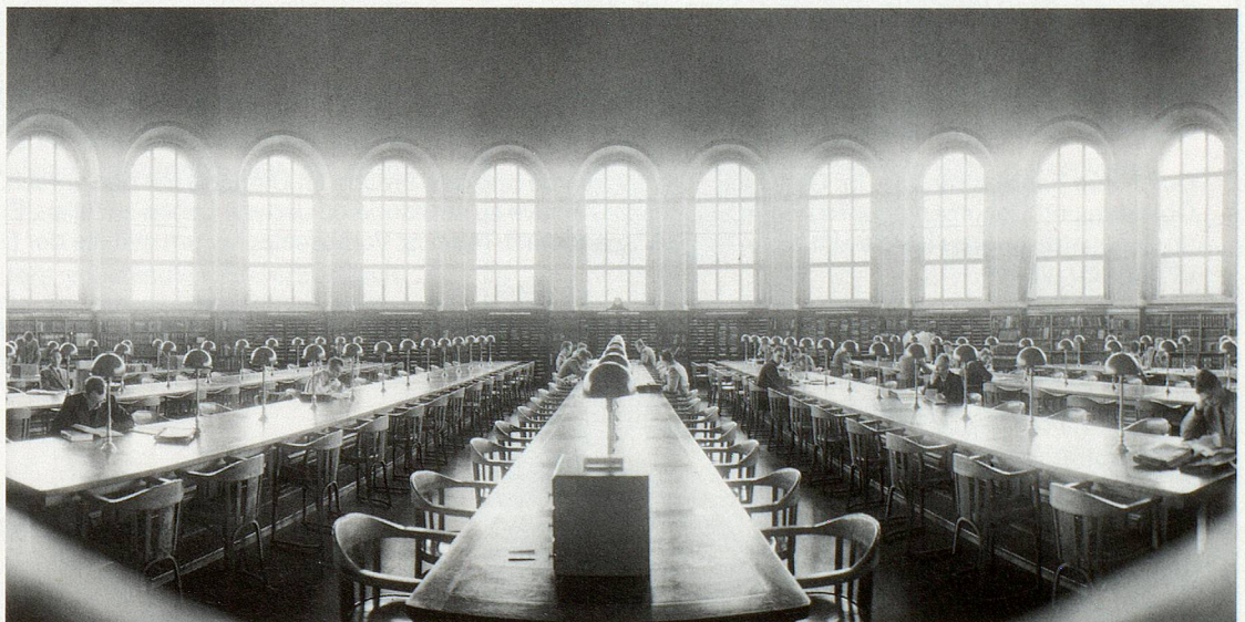
Lesesaal der ETH-Bibliothek, 1955.

ETH-Bibliothek Margit Unser Rämistrasse 101 8092 Zürich E-Mail: margit.unser@library.ethz.ch