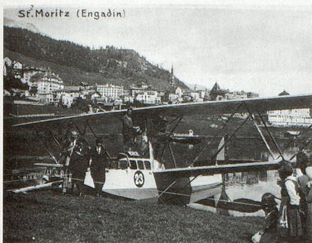
St. Moritz (Engadin)

Wasserflugzeug auf dem St. Moritzersee, ca. 1915 (das Flugzeug konnte nicht mehr starten und musste auseinander gebaut werden, da der See zu kurz war).