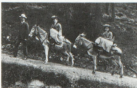
Kurgäste in St. Moritz, Ende des 19. Jahrhunderts.

Die Aufsicht über die Gemeinde-, Kreis- und Bezirksarchive wird durch das Staatsarchiv ausgeübt. Zu diesem Zweck werden seit mehr als einem halben Jahrhundert regelmässige Inspektionen durchgeführt. Das