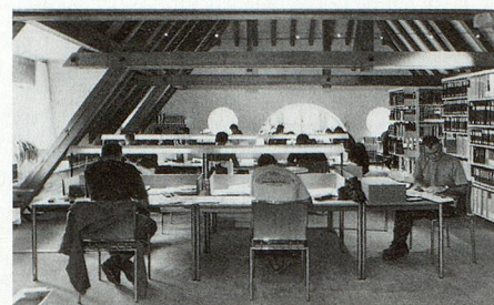
Blick in den einladenden Lesesaal des Staatsarchivs mit seinen 22 grosszügig bemessenen Arbeitsplätzen.

Das ständige Personal des Staatsarchivs umfasst 600 Stellenprozent, verteilt auf sie-