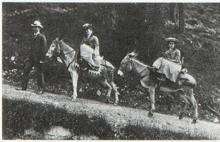
Kurgäste in St. Moritz, Ende des 19. Jahrhunderts.

Die Aufsicht über die Gemeinde-, Kreis- und Bezirksarchive wird durch das Staatsarchiv ausgeübt. Zu diesem Zweck werden seit mehr als einem halben Jahrhundert regelmässige Inspektionen durchgeführt. Das