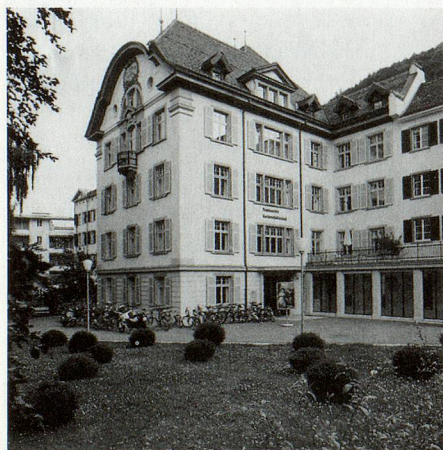
Das Archiv- und Bibliotheksgebäude am Karlihofplatz in Chur, eines der kulturellen Zentren der Bündner Metropole.

Seit 1803 Aufbewahrungsstelle der Schriften der kantonalen Verwaltung, beherbergt das Staatsarchiv auch das historische Archiv des ehemaligen Freistaates Gemeiner Drei Bünde (bis 1798), bestehend aus den Urkundensammlungen mit den wichtigsten Verfassungs- und Bündnisurkunden, aus gebundenen Handschriften,