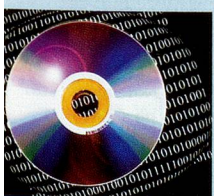
Photo-montage d'un CD audio numérique (CD-R). Il s'agit d'un disque en polycarbonate contenant des informations sonores stockées sous forme numérique. Sur un CD-R commercial, le son est «échantillonné» (découpé) à 44,1 KHz (en 44 100 tranches) et est codé sur 16 bits. Grâce à l'enregistrement numérique, un document peut être recopié sans aucune perte et sans ajout de souffle. Mais sa fiabilité dans le domaine de l'archivage sonore n'est pas reconnue.

Une dernière remarque: l'enthousiasme manifesté par les auteurs ayant été tel, la longueur des articles s'en est aussi ressentie, c'est pourquoi nous avons été obligés