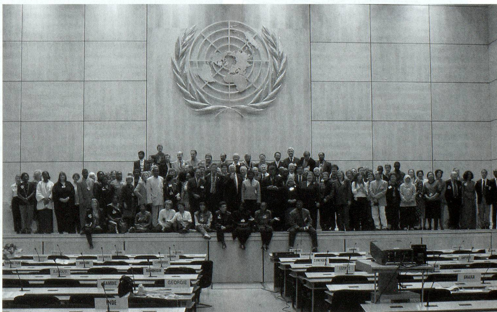
3.-4. novembre 2003: Pré-Sommet IFLA/WSIS – Les bibliothécaires à l'ONU, Genève.