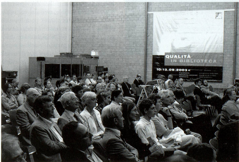
Assemblea generale 2003 della BBS.