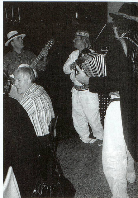
Il trio «Tri per dü».