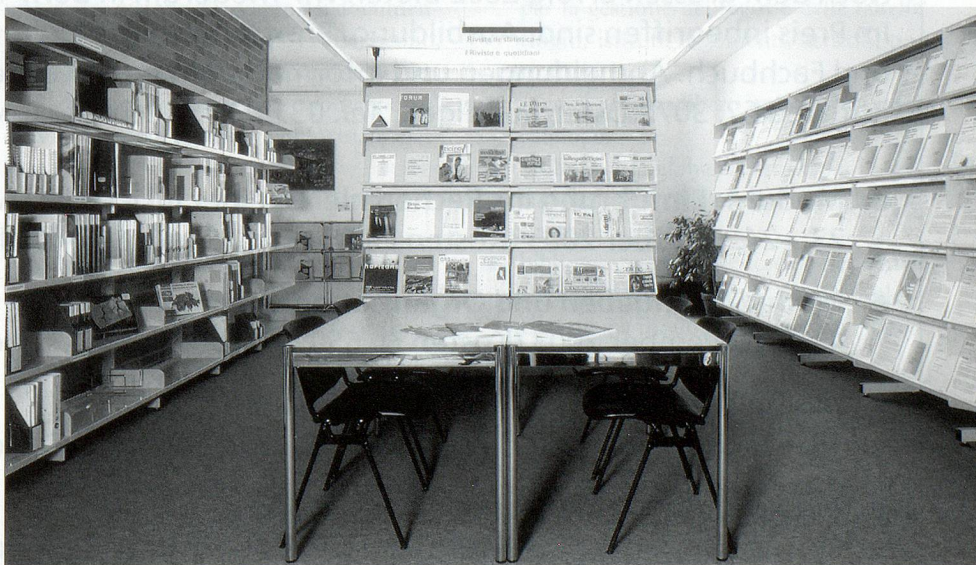
La sala dei quotidiani, delle riviste e degli annuari statistici.

La massa di informazioni raccolta e catalogata svolge una doppia funzione: da un la-