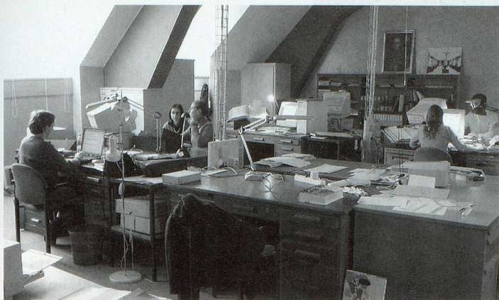
Vue de la salle de travail des archivistes.