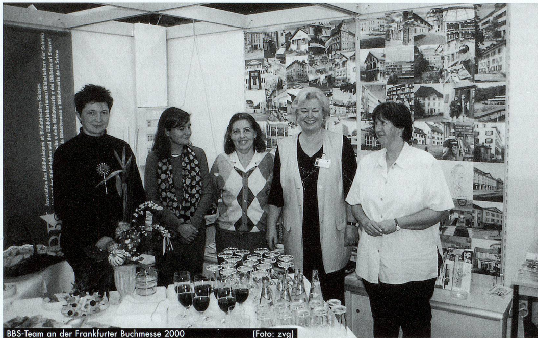
BBS-Team an der Frankfurter Buchmesse 2000