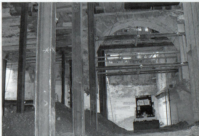
Realisierung einer Vision: Grossflächige Unterkellerung der Altstadtliegenschaften «Tösserhaus» und «Blumengarten». In diesen Altstadtliegenschaften, die teilweise bis ins 12. Jahrhundert zurückreichen, entsteht in enger Zusammenarbeit mit der Denkmalpflege die neue, achtschöckige Stadtbibliothek Winterthur. Dank Selbstverbuchung und Rückgabebautomaten wird sich das Personal voll der KundInnenberatung widmen können.