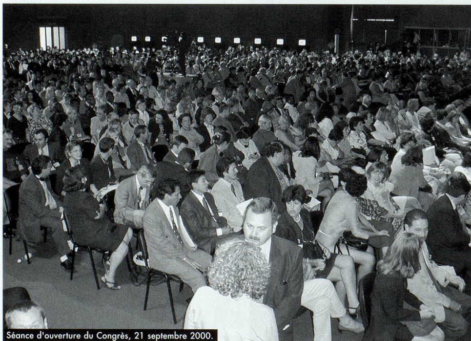
Séance d'ouverture du Congrès, 21 septembre 2000.

ICA/SPP – Section des archives des parlements et partis politiques