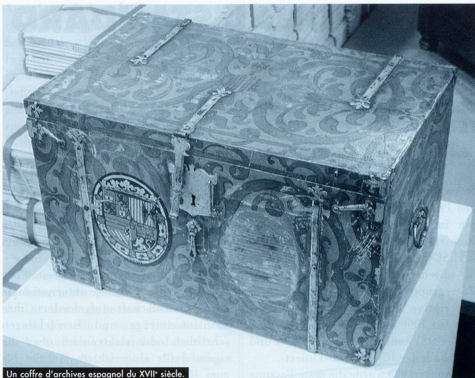
Un coffre d'archives espagnol du XVII e siècle.

nisations internationales non gouvernementales chaque fois qu'il convient, ce comité entreprend des études et des recherches sur les sceaux de façon à en approfondir les connaissances, élaborer des normes pour leur description et des guides pour leur préservation, leur conservation et leur restauration, et en ces domaines promouvoir les échanges de vue et d'expérience.