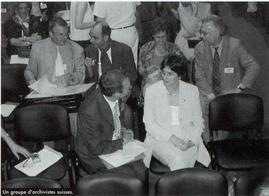
Un groupe d'archivistes suisses.

ICA/SUV – Section des archives des universités et des institutions de recherche