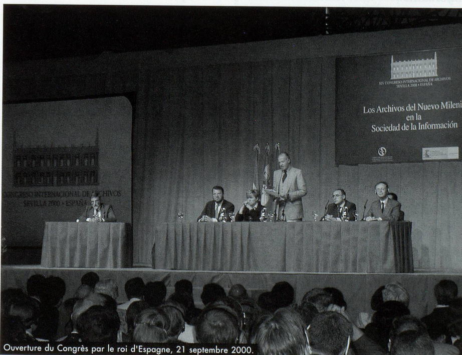
Ouverture du Congrès par le roi d'Espagne, 21 septembre 2000.

leur système informatique qui contient 12 millions d'images. Les Archives des Indes contiennent les actes espagnols sur la colonisation de l'Amérique.