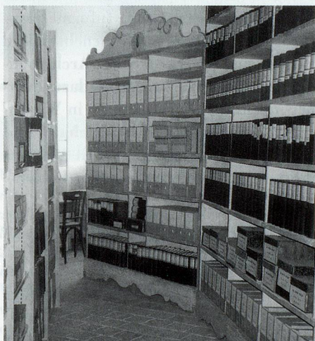
Château de Porrentruy, Tour du Coq, ancien mobilier d'archives installé au milieu du XVIII e siècle par l'archiviste Maldoner.

Le relazioni regionali, transfrontaliere e internazionali sono un elemento essenziale per l'avvenire professionale degli archivisti.