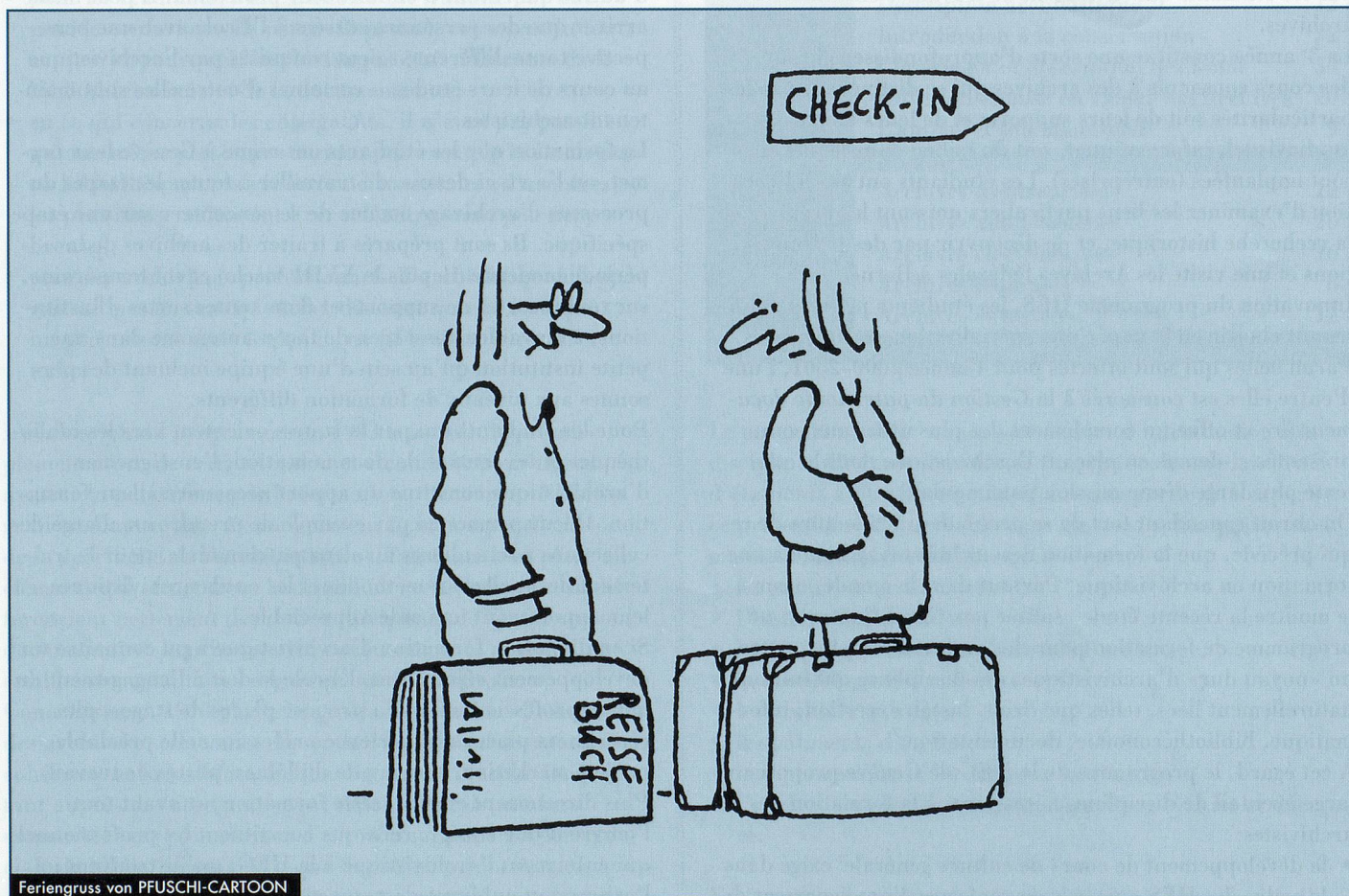
Feriengruss von PFUSCHI-CARTOON