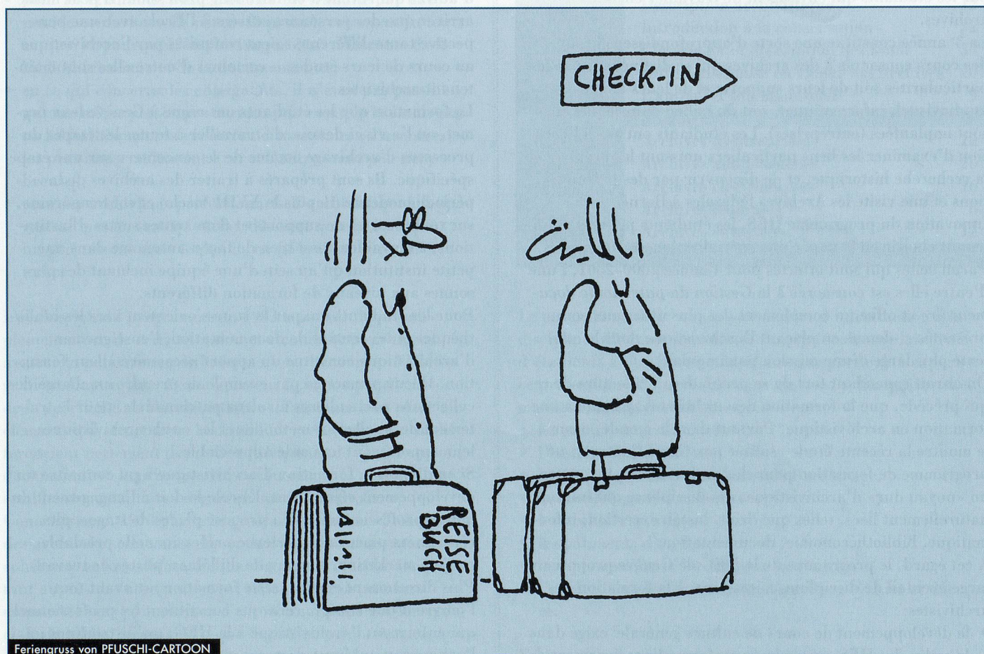
Feriengruss von PFUSCHI-CARTOON