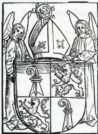
Kaspar zu Rhein: Wie man messen haben mag in interdicto (Basel, Drucker der Copyen, um 1488)