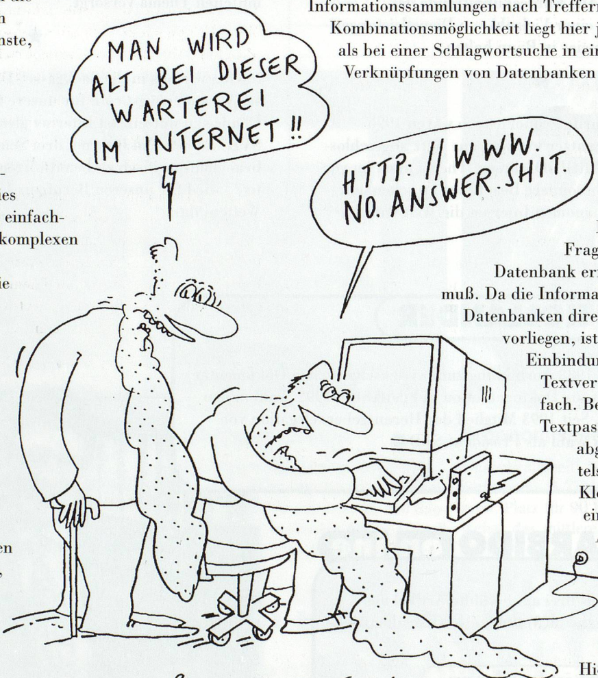
PFEUSCH - CARTOON

Anhand der gewonnenen Fakten lassen sich die Recherchen vertiefen und weitere Ergebnisse ermitteln. Hier nimmt mittlerweile die Nachbearbeitung der