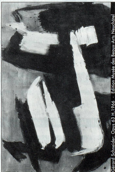
Gérard Schneider: Opus 63 H, 1966. Edition Musée des Beaux-Arts Neuchâtel