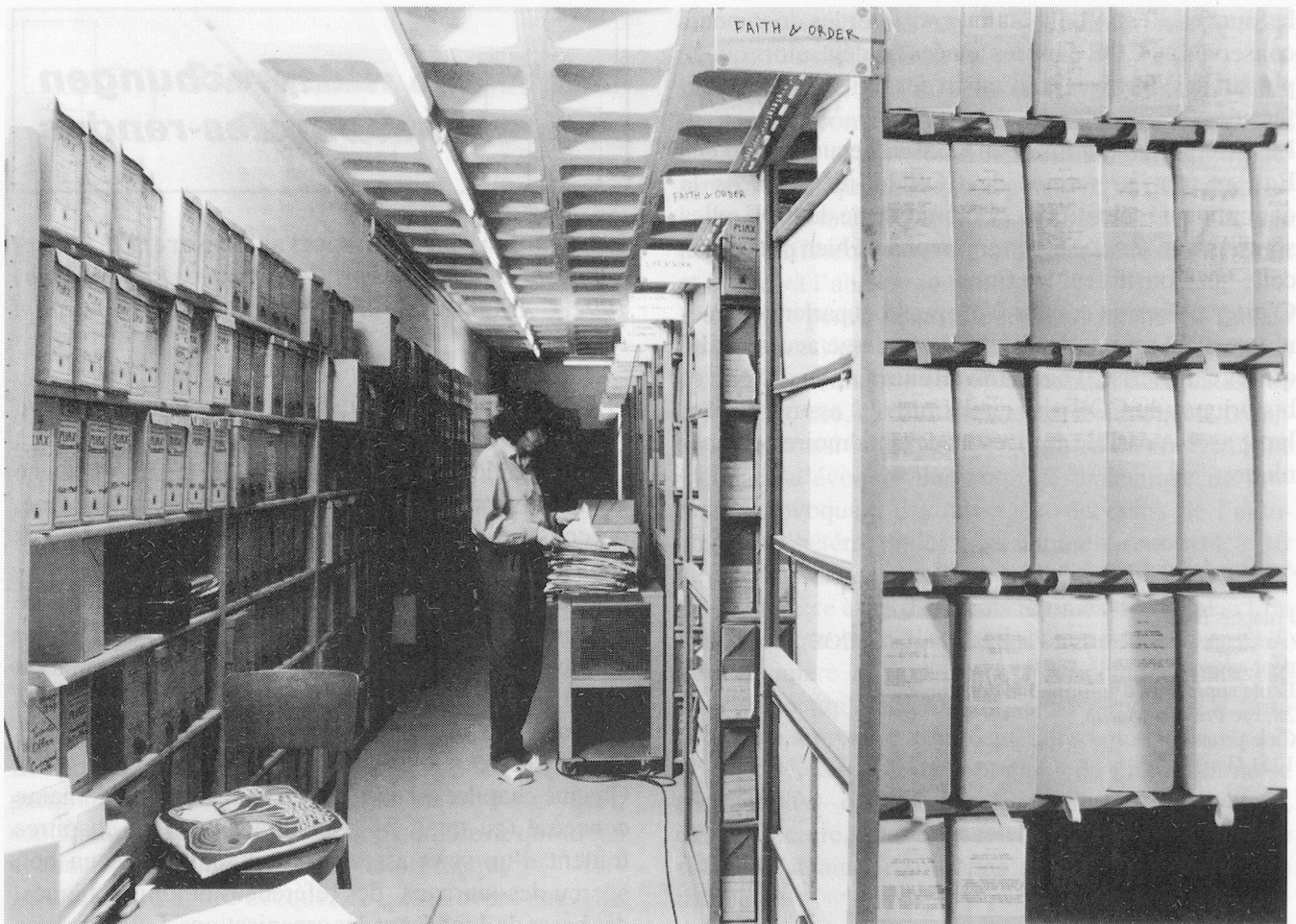
Une partie des Archives historiques du COE

Seule une politique des archives à l'échelle du COE tout entier pourra assurer l'avenir des Archives historiques, en leur épargnant la paralysie par engorgement.