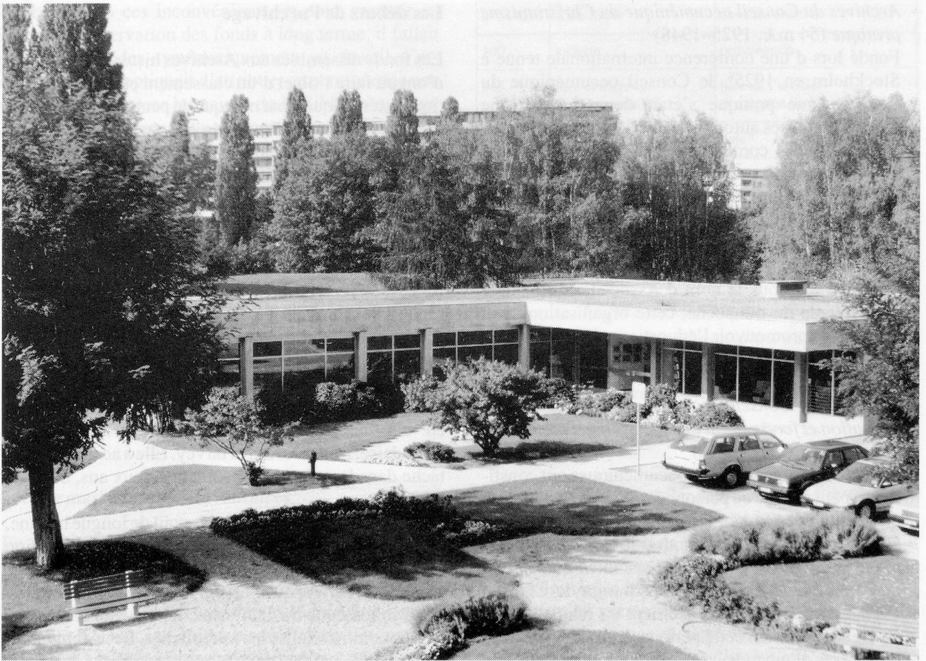
La Bibliothèque du Conseil oecuménique des Eglises au Grand-Saconnex

De vastes locaux aménagés en sous-sol ont permis de conserver dans des conditions favorables – même d'après les sévères critères actuels – des fonds d'archives toujours plus nombreux.