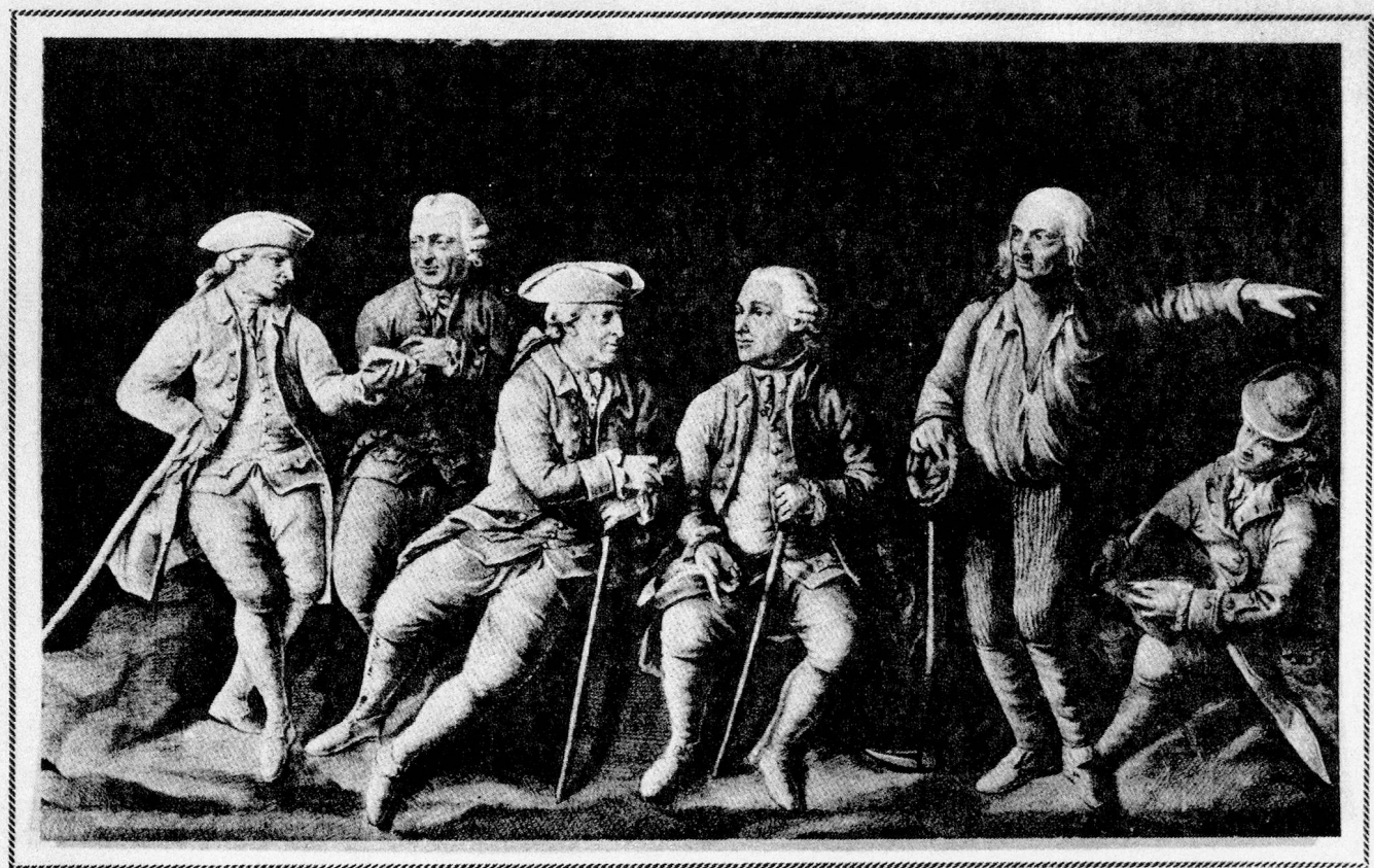
J. V. Sonnenschein sculp.

dem Katzenrütihof bei Rümlang. "Kleinjogg" ist einer der wenigen Zürcher Bauern, die mit Namen Eingang in die Geschichtsbücher gefunden haben. Schon zu seinen Lebzeiten galt er in Gebildetenkreisen halb Europas als populäre Figur. Daran trug hauptsächlich der Zürcher