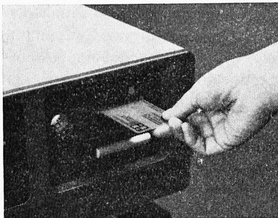
Abb. 1 Benutzeridentifikation