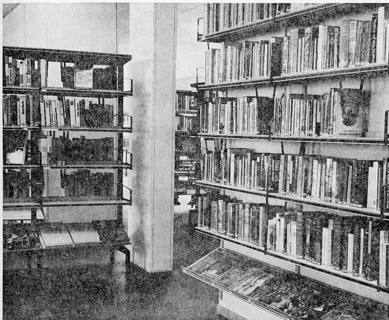
Stadtbibliothek Baden (AG)