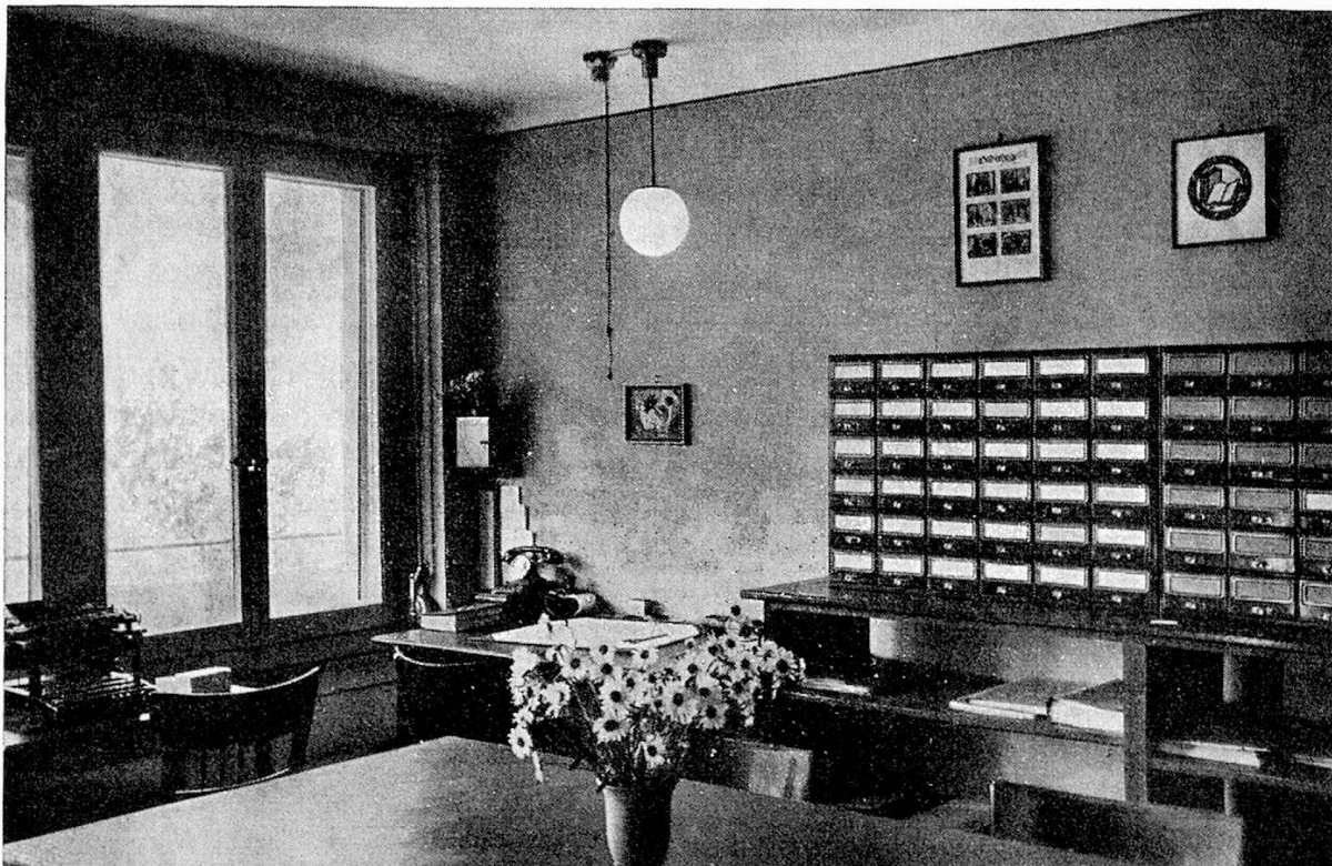
Der Zentralkatalog unserer 7 Kreisstellen in Bern

Bibliothekarbeit ist nie Selbstzweck, sondern sie bedeutet Dienen, und Bibliothekarbeit gedeiht nur bei hilfsbereiter Zusammenarbeit. Dienen und helfen: dies soll der Wahrspruch der Schweizerischen Volksbibliothek auch fürderhin sein.