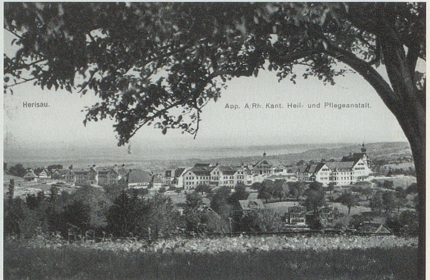
Herisau, Psychiatrische Klinik, um 1920, Postkarte.

Offenheit als Therapie – die Natur wird nicht durch hohe Mauern ausgesperrt. Vielmehr kann die Natur ihre heilsame Rolle spielen: Die Ausserrhoder Landschaft «drängt sich von allen Seiten in die Anstalt hinein». Das tut gut, jeder Blick in die Natur bringt etwas Erholung – für Ärzte, Pflegende und für die «nicht allzu Kranken, nicht gar zu sehr in sich selbst Eingesponnenen». Naturstimmungen können in der «Herisauer Anstalt