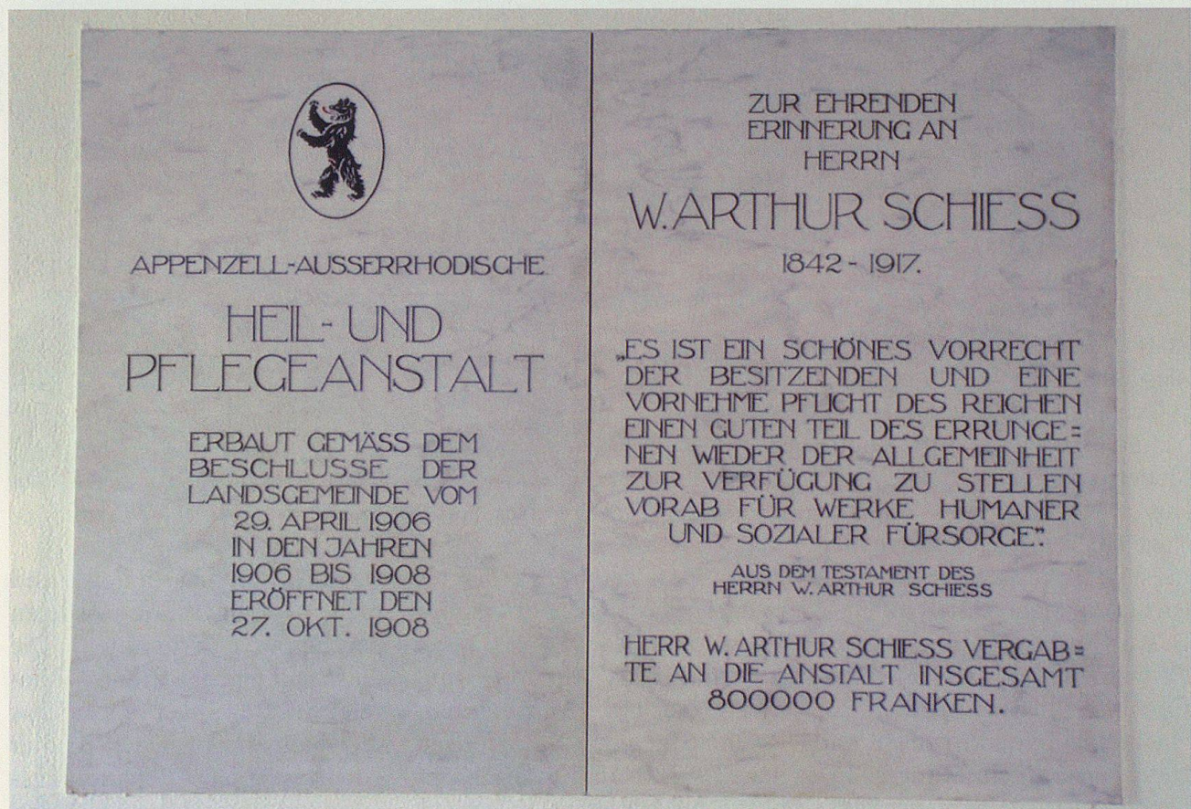
Inschrift W. Arthur Schiess.

Offenheit als Konzept – das war zukunftsweisend und hat sich bewährt. Trotz Verzicht auf Mauern und Zäune, auf alles «Irrenanstalts- und Kasernenmässige», gab es «nicht mehr Entweichungen» als in den da-