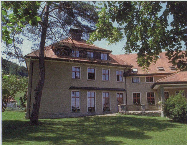
Haus 6 mit dem Sozialpsychiatrischen Dienst und Hallenbad.