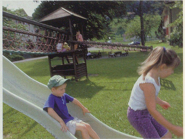
Der öffentliche Spielplatz ist attraktiv für die Herisauer Kinder.