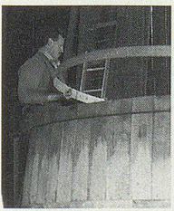
Wie entsteht ein 5000-Liter-Fass?