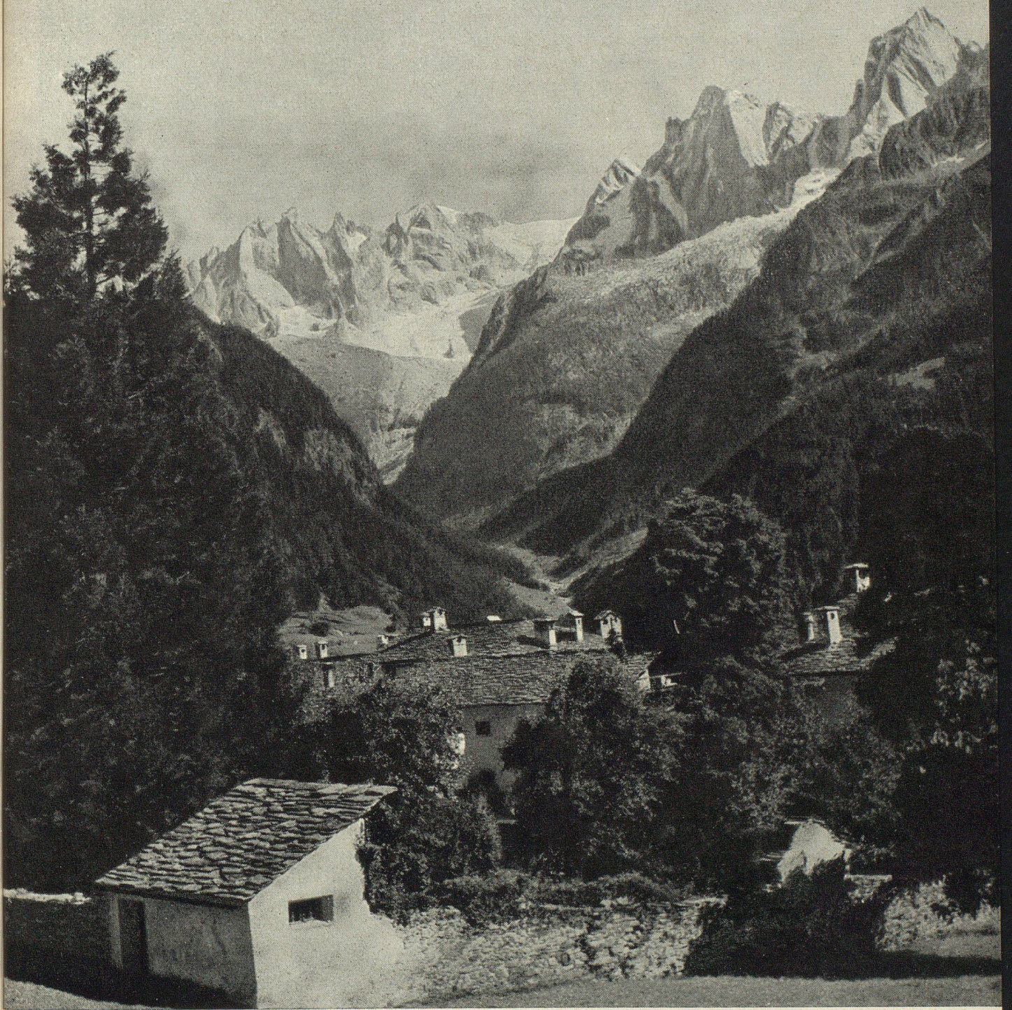
Parkanlage in Soglio. Blick in die Bondasca-Gruppe. Im Vordergrund der prächtige alte Parkgarten des Palazzo Salis mit seinem bunten Gemisch nordischer Nadelhölzer u. südländischer Pflanzenarten (Edelkastanien). Hier malte Segantini eines seiner schönsten Alpenbilder.