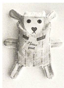
Stääsack selber machen, S. 83