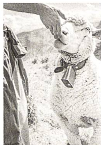
Die Alpzeit im Alpstein hält die Schafe fit, S. 53