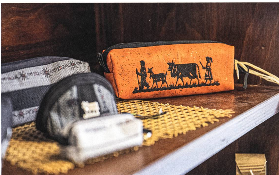
Wer claro-Produkte kauft, hilft mit, dass die Produzenten fair entlohnt werden.

ihre Produkte zu fairen Preisen über eine vertrauenswürdige Organisation verkaufen können.»