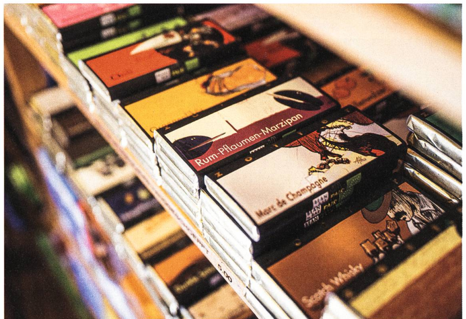
Was im Bionat in Heiden in den Regalen steht, hat das Team gewissenhaft vorselektiert.