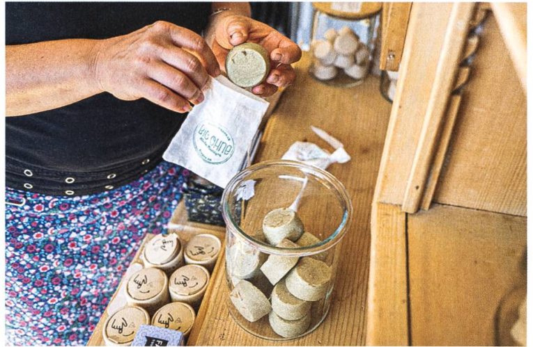
Einkaufen im Unverpackt-Laden ist auch ein Erlebnis für die Sinne.