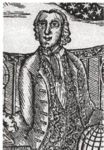
300 Jahre Appenzeller Kalender: mehr als ein Presseerzeugnis, S. 53