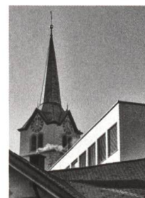
Rundgang durch Herisaus Dorfkern, S. 84