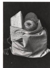
Nähanleitung für einen Reisebeutel, S. 79