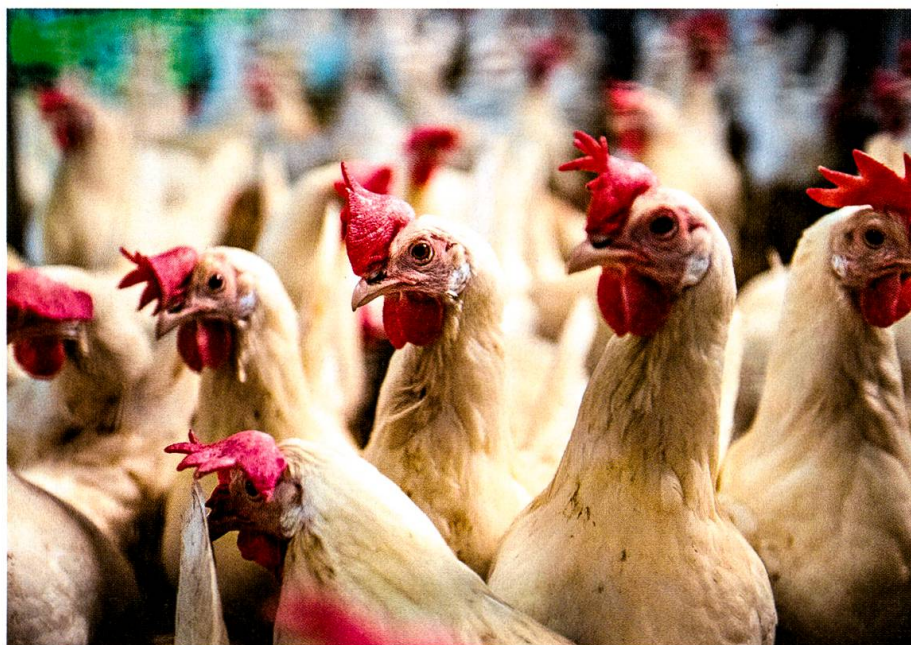
Ruschs produzieren Milch und Eier in Bio-Qualität.

Schweiz muss – im Gegensatz zur EU – immer der ganze Hof mit allen Betriebszweigen auf Bio umgestellt werden. Zwei Jahre dauert die Umstellung: Während dieser Zeit produziert der Bauer zu Bio-Bedingungen, darf die Produkte aber nicht zu Bio-Preisen verkaufen. Diese Regel