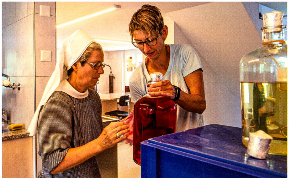
Allein können die Schwestern die Produktion nicht bewältigen. Sie sind auf Mitarbeiterinnen angewiesen.

Heute gibt es weniger Klöster und folglich weniger Klosterapotheken. Die kleinen Gemeinschaften sind meistens nicht mehr in der Lage, die Produkte in ausreichender Menge selbst herzustellen; so ist Wissen um natürliche Heilmittel verloren gegangen. Das Kloster Leiden Christi bildet eine Ausnahme. Neun Schwestern leben am Fuss des Kronbergs. Jede hat ihre Aufgabe innerhalb der Gemeinschaft, einige helfen im Laden mit. Doch sie allein können Produktion und Verkauf nicht bewältigen: Fünf Mitarbeiterinnen sind in der Klosterapothekeschäftigt, ein Mann arbeitet ehrenamtlich. Der Klosterladen ist ein Unternehmen. Ein kleines,