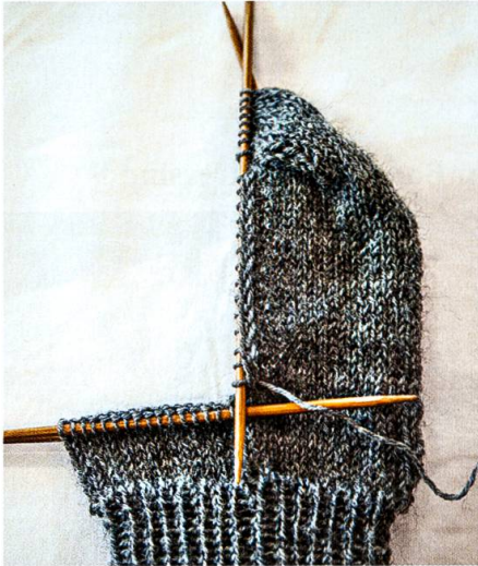
Aufstricken der Randschlingen.