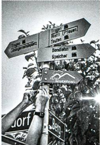
800 Kilometer Wanderwege, S. 53