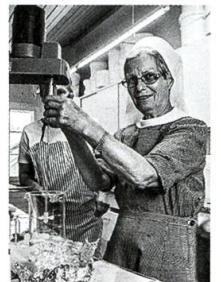
Klosterladen Leiden Christi S. 70