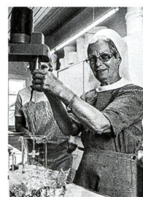
Klosterladen Leiden Christi S. 70