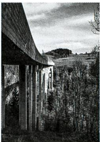
Brücken: Wettbe- werb, S. 68