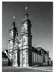
Stadtrundgang in St. Gallen, S. 84