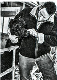
Im Einklang mit der Natur, S. 76